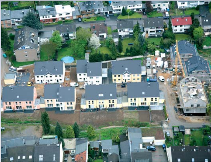
BV Töpfergasse: 2008 entstanden 18 hochwertige Reiheneigenheime, 2 Doppelhaushälften und 1 freistehendes Einfamilienhaus

schwinden, wächst die Berafin Bauräger GmbH weiter, etabliert sich immer mehr als gefragter Spezialist. Der Grund liegt für das Geschäftsführer-Duo klar in ihrem Unternehmensmotto begründet: Preiswert, fair, solide, seriös. „Unsere Kunden vertrauen uns ihr Geld an – und erhalten dafür bestmögliche Ergebnisse. Ist der Kunde zufrieden, sind wir es auch.“ Diesen Anspruch überprüfen sie jeden Tag auf's Neue. „Wir können es garantiert nicht jedem recht machen, versuchen aber immer, 100% zu geben. Gerade beim Bau der eigenen vier Wände ist es immer schwer, der Mittler zwischen der Vorstellung des Erwerbers und den realen Möglichkeiten zu sein. Jeder unserer Erwerber tätigt diese Investition nur einmal im Leben. Und das ist die Besonderheit in unserem Geschäft. Täglich muss der