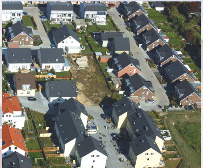
BV in Lechenich: 2008 entstanden 18 hochwertige Reiheneigenheime, 2 Doppelhaushälften und 1 freistehendes Einfamilienhaus