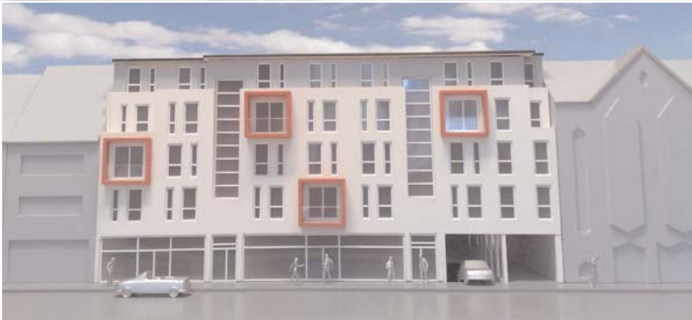
Das neue Wohn- und Geschäftshaus an der Uhlstrasse

Alles fing mit einer vagen Idee an: Der Immobilienmarkt braucht frischen Wind – vor allem für Familien mit Kindern muss das Angebot deutlich verbessert werden. Preis und Leistung sind hier entscheidend. Mit dieser Unternehmensphilosophie startete die Berafin Bauträger GmbH – 1991 fiel der Startschuss!