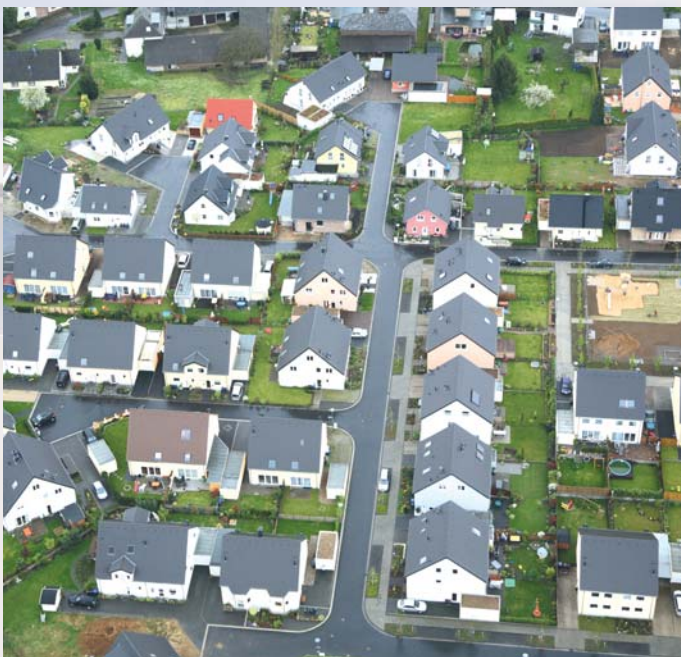
BV Geildorfer Feld in Brühl: Erstellung von 54 Einfamilienhäusern in 2006

Wer mehr wissen möchte: www.berafin.de oder 02232 – 9 69 10.