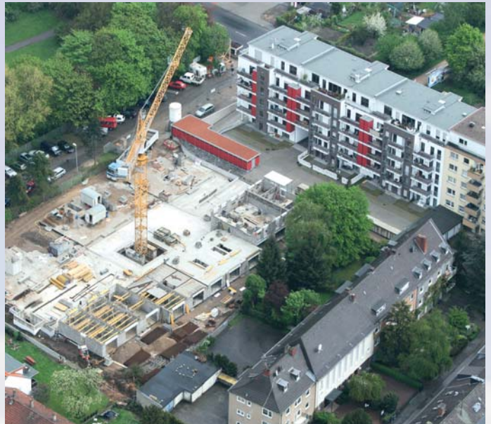
BV Niehler Straße: in 2 Bauabschnitten entstanden 68 Eigentumswohnungen und 11 Einfamilienwohnhäuser