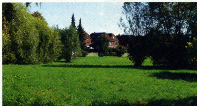
Innerstädtisches Filetstück: An der Liblarer Straße entsteht zwischen Georg-Sandmann-Straße und Heinestraße ein attraktives Wohnquartier