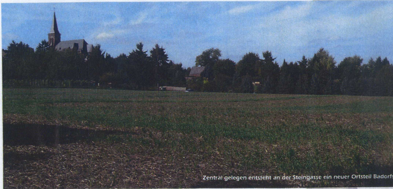
Zentral gelegen entsteht an der Steingasse ein neuer Ortsteil Badorf.

Exklusiven großzügigen Einfamilienhäuser sowie zehn Reihenhäuser entlang der Steingasse. Mehrfamilienwohnhaus mit flexiblen Grundrissen und eine Gewerbeeinheit im Erdgeschoss mit rund 500 qm runden das Bauprojekt